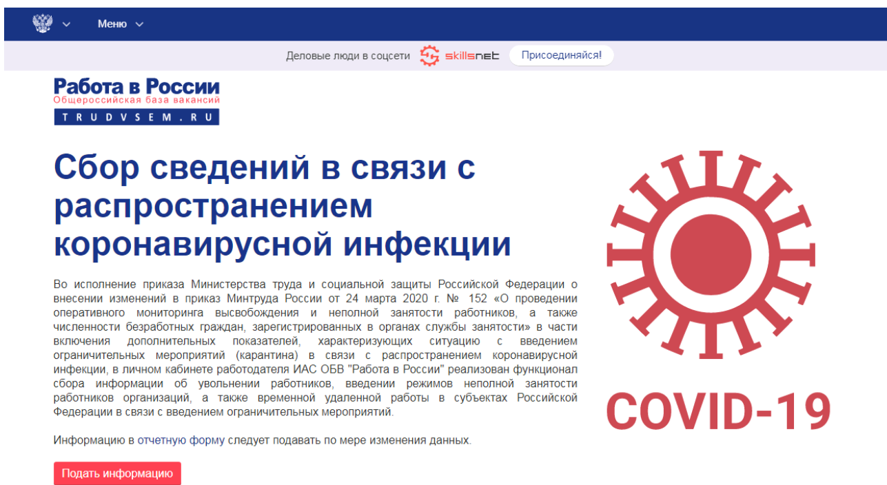
Рис. 2. Информационная страница